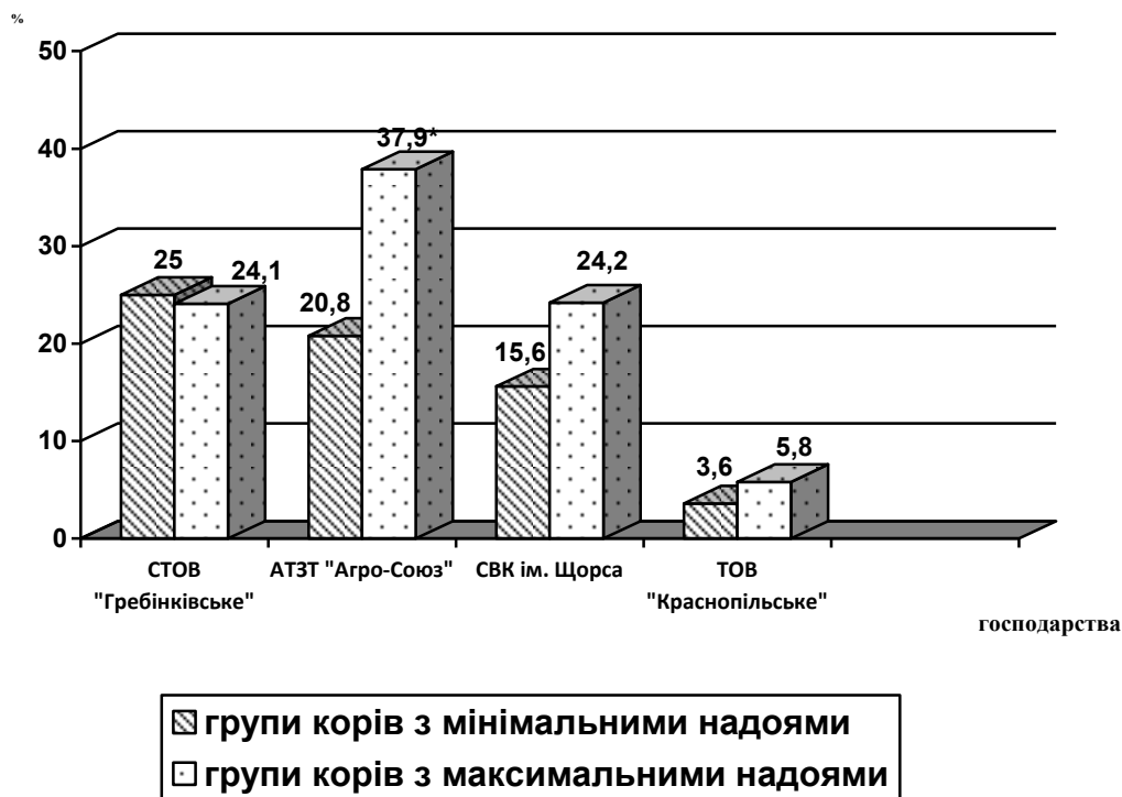
Рисунок 2. Частота виникнення ортопедичної патології у корів з різною продуктивністю.

Звичайно, враховуючи поліфакторність і акушерської патології, і ортопедичних хвороб, високу молочну продуктивність слід розглядати лише як додаткову сприяючу передумову в комплексній дії основних етіологічних чинників.